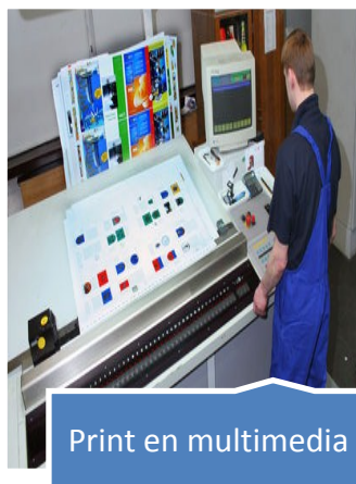
Print en multimedia